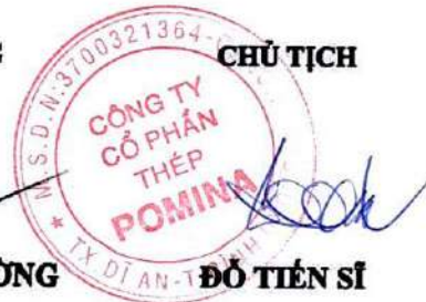
ĐỖ TIÊN SĨ